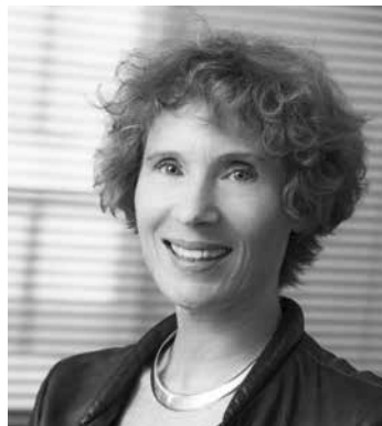
Par Marie-Laure Dreyfuss , Déléguée générale du CTIP

Confrontés à ces défis multiples, les institutions de prévoyance et les groupes de protection sociale peuvent compter sur l'implication de toute l'équipe du CTIP. Nous serons à leurs côtés au sein de nos commissions et groupes de travail, notamment pour éclairer les nombreuses problématiques nouvelles ou expertiser les solutions. Mais surtout, nous serons