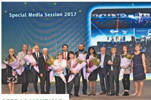
AG2R LA MONDIALE