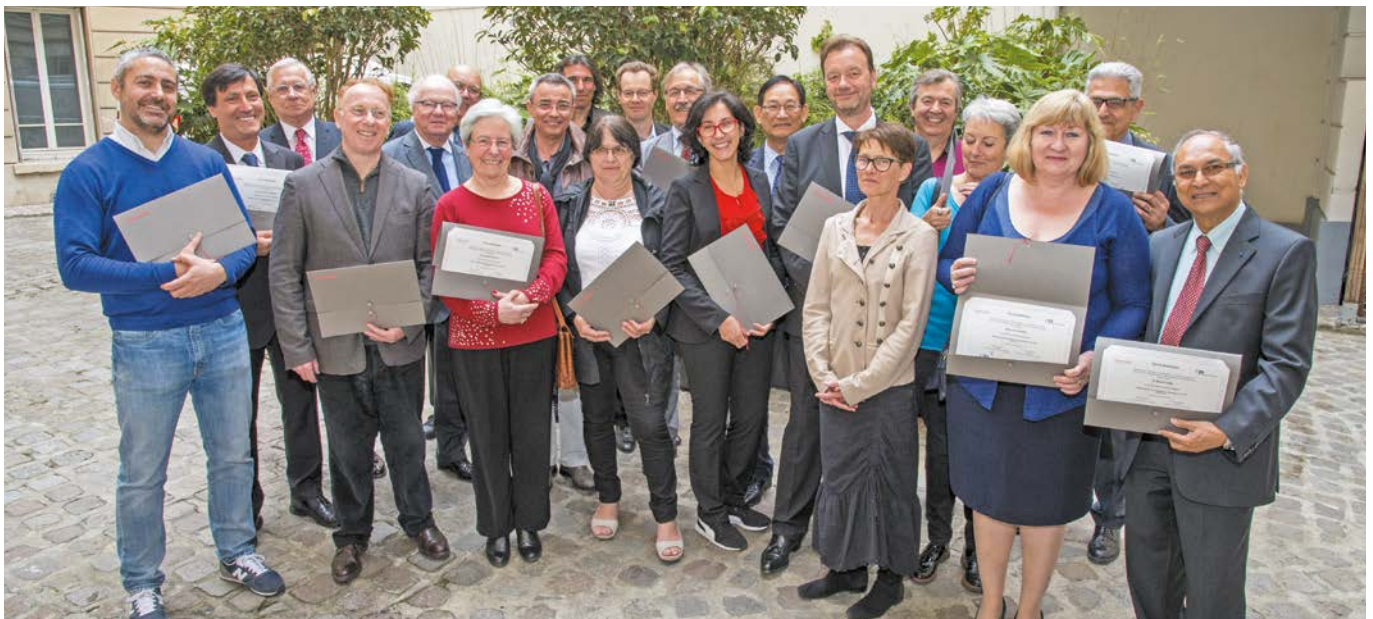
Remise des diplômes de la deuxième promotion de la formation CTIP IFA-Sciences Po, 25 avril 2017.

— Mise en place avec l'appui du CTIP en janvier 2016, la formation CTIP IFA-Sciences Po pour les administrateurs des groupes de protection sociale (GPS) rencontre auprès de ces derniers un réel engouement.